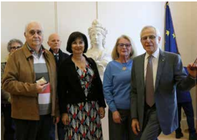
24 JANVIER : Lors de la traditionnelle cérémonie des vœux les représentants du Conservatoire , de Gymforme St-Nom et des Amis de Saint-Nom ont reçu la médaille de la ville des mains du Maire.