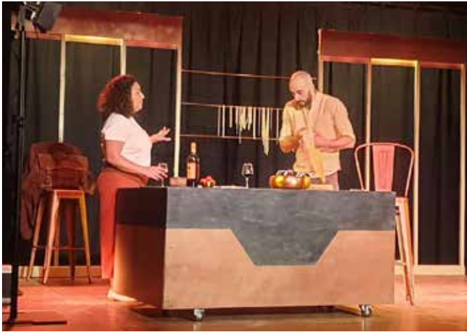
10 JANVIER : « Voyage à Napoli » offrait une plongée dans les contradictions de l'amour moderne, une pièce aussi drôle que touchante programmée par le service culturel à l'Espace JKM.