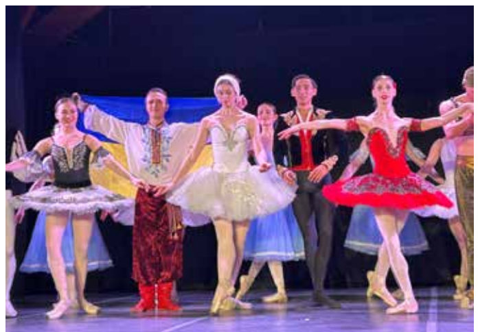
30 JANVIER : Le spectacle « Les Étoiles de la Danse » a réuni à l'Espace JKM, les danseurs Étoiles issus des opéras de Kiev, Madrid, Tokyo et du Royaume-Uni, accompagnés par le Grand Ballet de Kiev.