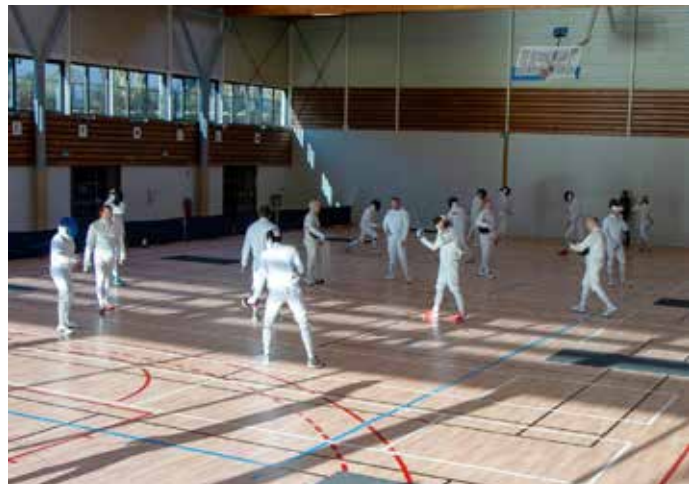
24 JANVIER : 40 tireurs représentant 17 clubs de la région parisienne ont rejoint le cercle d'escrime de notre village, à l'occasion du 38 e Challenge Pierrick Mounier au Pôle sportif Teddy Riner.